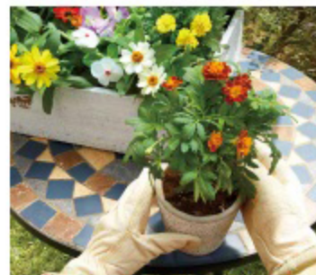
ガーデニングをする